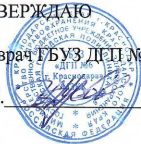
График работы медицинского кабинета МАОУ СОШ № 5